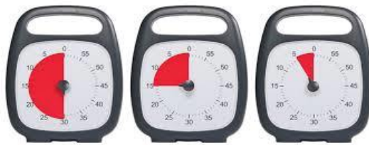
På billedet: Time timer

Når vi tilrettelægger barnets dag, er vi opmærksomme på, hvilke aktiviteter barnet skal lave før og efter en fællesaktivitet. Det kan fx være, at barnet skal være fysisk aktivt eller have en stillesiddende aktivitet inden eller efter en fællesaktivitet, hvilket er meget individuelt fra barn til barn. Det er meget vigtigt at tage højde for dette, da vores børn ved overstimulering kan få en kraftig reaktion, enten i form af uro, gråd eller udadreagerende adfærd. Nogle gange kommer reaktionen forsinket, dvs. flere timer efter og måske først når barnet er kommet hjem.